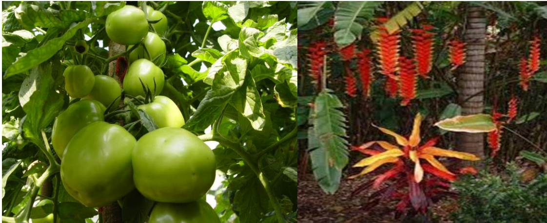
Plantio de Tomates com Rockall Nitrogenado

Pastagens: 800 kg/ha no plantio. Em pastagens já existentes, 800 kg/ha em cobertura.