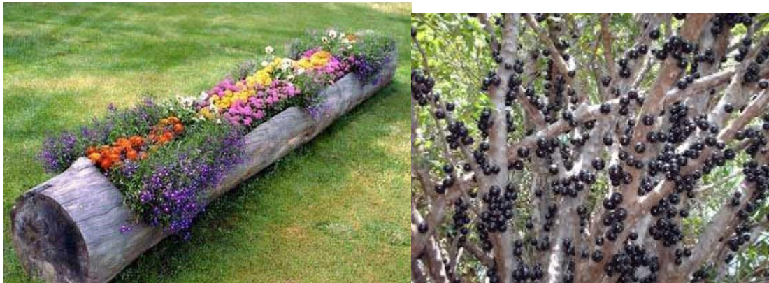
Jardins com *CS 4;1 Fruteira com Rockall Nitrogenado